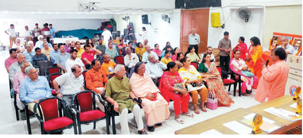
चंडीगढ़ में मुख्यमंत्री श्री नारायण सिंह सैनी

हिन्द जनपथ चंडीगढ़ (ब्यूरो)। सेवा धाम, सेक्टर 29 में ट्रांसजेंडर व्यक्ति (अधिकारों का संरक्षण) अधिनियम 2019 एवं नियम 2020 पर एक दिवसीय जागरूकता कार्यक्रम विद्या देवी चैरिटेबल ट्रस्ट, राष्ट्रीय समाज रक्षा संस्थान (एनआईएसडी), केंद्रीय सामाजिक न्याय एवं सशक्तिकरण मंत्रालय, भारत सरकार एवं सामाजिक संगठनों के संयुक्त तत्वावधान में हुआ जिसमें वक्ताओं ने समाज में ट्रांसजेंडर समुदाय की समान भागीदारी और अधिकार सुनिश्चित करने की आवश्यकता पर बल दिया।